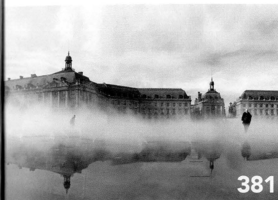
RAFFRESCAMENTO AD ACQUA